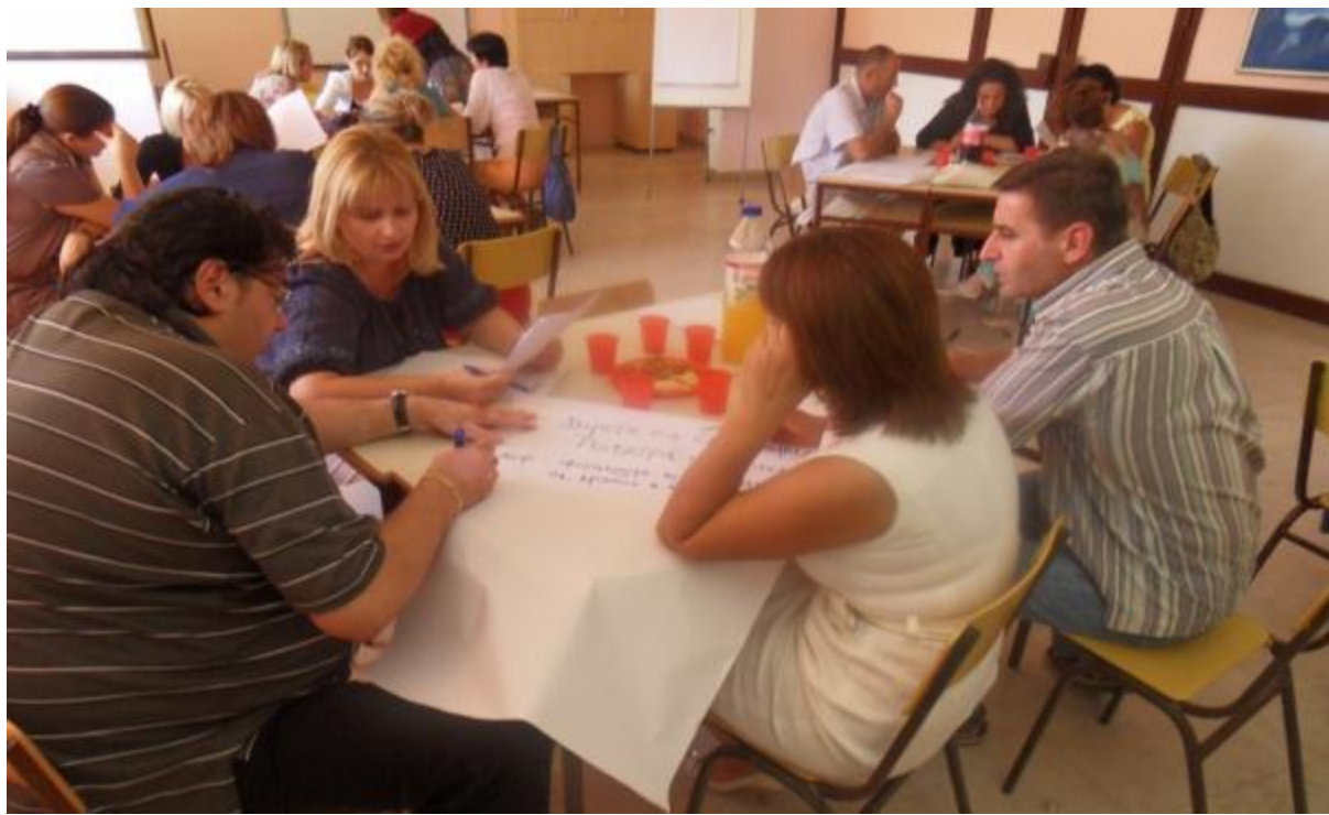
Grupni rad nastavnika