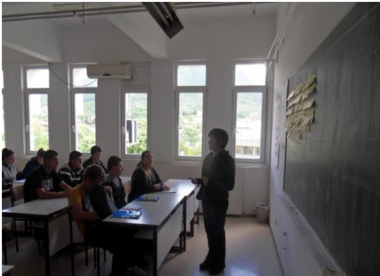
Diferencirani zadaci po grupama: Ugledni čas Fizike