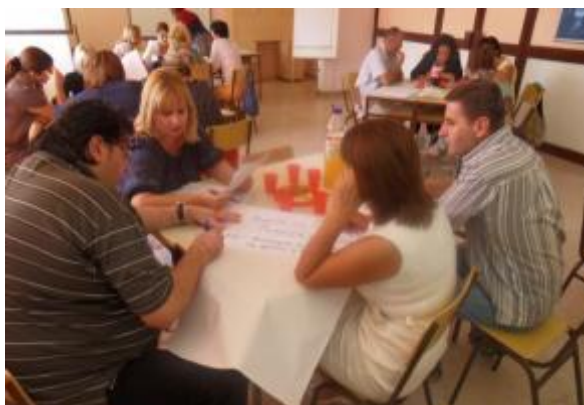
Grupni rad nastavnika

U Srednjoj poljoprivrednoj školi, 28. i 29. oktobra realizovan je seminar za nastavnike opšteobrazovne grupe predmeta ( 10 ) . Nakon realizovanog seminara stečena znanja i iskustva prezentovana su nastavnicima stručno-teorijske grupe predmeta u okviru Stručnog aktiva za mašinsku i saobraćajnu grupu predmeta. Realizovane su dvije radionice: