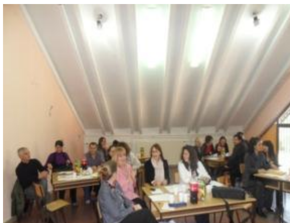
Razmjena iskustava... nastavnici srednjih stručnih škola iz Bara i Ulcinja