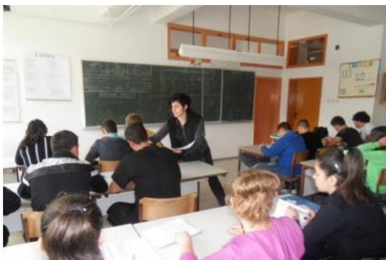
Ugledni čas fizike

Rješavanjem asocijacija vezanih za agregatna stanja i podjelom zadataka unutar grupa učenici sistematizovali pojmove i znanja vezana za čvrsta tijela i tečnosti. Na času Fizike primijenjen je diferencirani rad u grupi/ svaka grupa dobila je posebni zadatak, dio nastavne jedinice, ali se i unutar svake grupe obavila podjela rada prema složenosti zadataka.