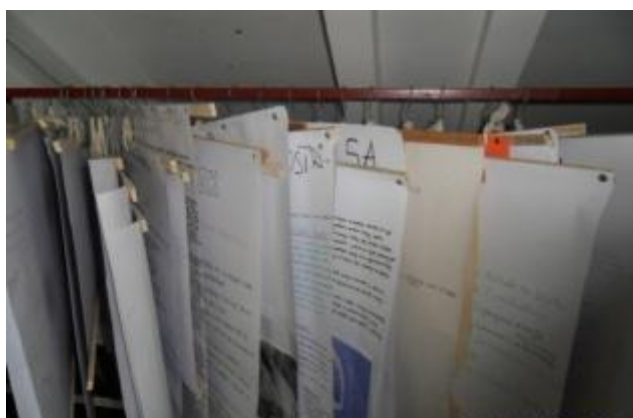
Panoi učenika izradjeni tokom školske 2011/12.g.