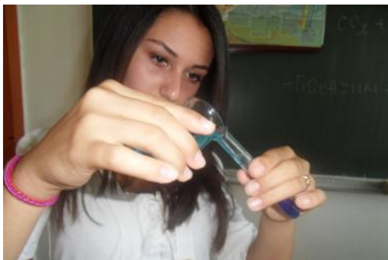
Zanimljiva Biohemija - izvodjenje ogleđa

Rješavanjem asocijacija vezanih za agregatna stanja i podjelom zadataka unutar grupa učenici sistematizovali pojmove i znanja vezana za čvrsta tijela i tečnosti. Na času Fizike primijenjen je diferencirani rad u grupi/ svaka grupa dobila je posebni zadatak, dio nastavne jedinice, ali se i unutar svake grupe obavila podjela rada prema složenosti zadataka.