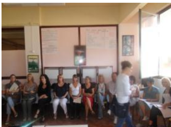
Na jednoj od radionica...

Cilj koji se odnosio na pomoć nastavnicima u radu sa djecom sa smetnjama u razvoju (inkluzivna nastava) (cilj 2) nemoguće je u potpunosti realizovati obzirom na kompleksnost njegove primjene u nastavnoj praksi. U redovni školski sistem uključen je 1 učenik, mada je znatno veći broj djece sa teškoćama u učenju i razvoju ali nisu kategorisana zbog nemarnosti i nezainteresovanosti roditelja. Škola je iz sopstvenih sredstva organizovala dvodnevni seminar za 21 nastavnika. Učesnici su ocijenili da je seminar odlično organizovan, stručno vodjen i za nastavnu praksu dragocjen. Stečena znanja primjenjivaće se u nastavnoj praksi i u skladu sa predlozima Komisije za usmjeravanje djece sa smetnjama u razvoju.