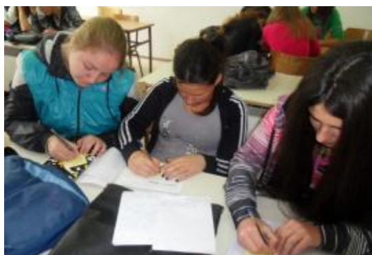
I-2 odjeljenje Grupni rad- zoologija